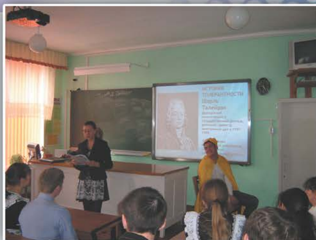
Игра: «Приветствуем друг-друга»