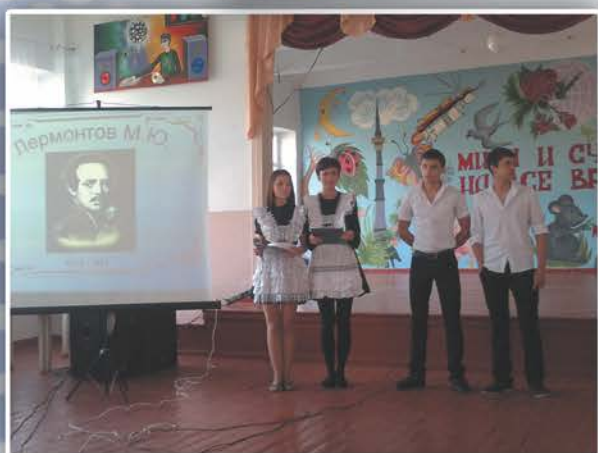
Презентация: «И голос лиры вдохновенной»