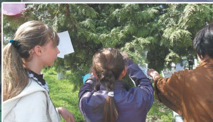
Игра: «Мы разные, но мы равные»