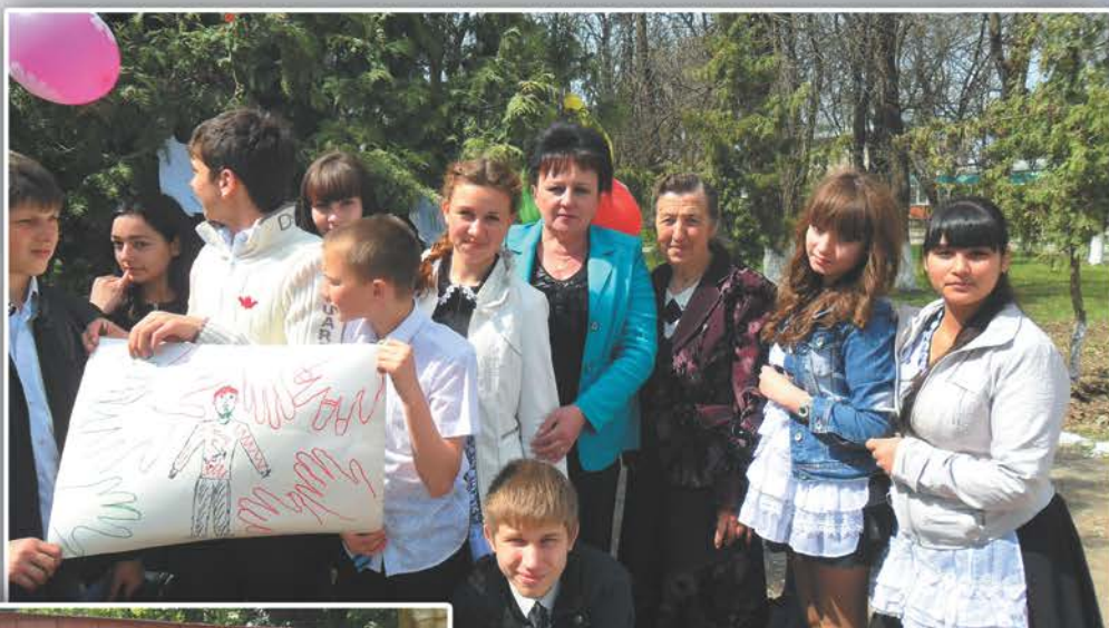
Игра: «Наша истинная ценность человек»