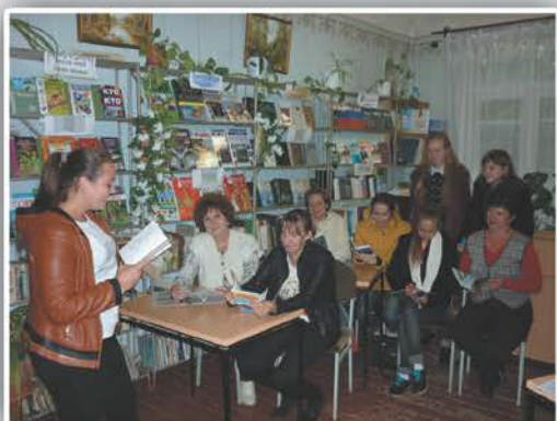
Викторина-игра: «Знай, люби и охраняй»