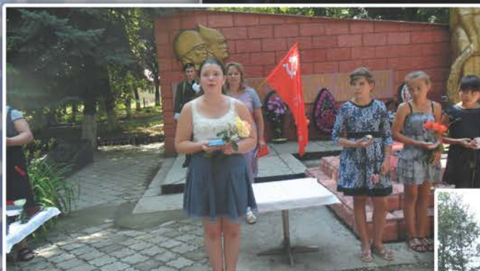
Литмоб: «Читаем вместе о войне»