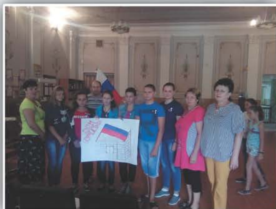
Символ славы и побед. День флага