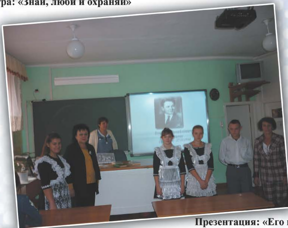
Презентация: «Его имя носит наша библиотека - Г. М. Брянцев»