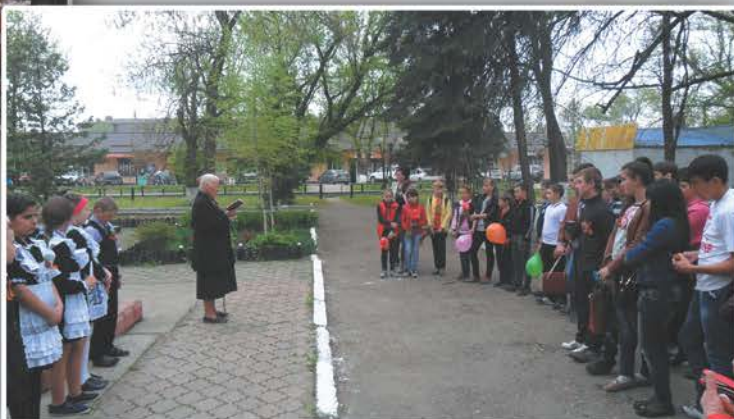
Час памяти: «Многое забудется, такое - никогда»